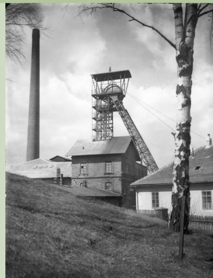
Obr. č. 6: Důl Anna v Příbrami-Březových Horách na snímku z r. 1927 s 32 m vysokou ocelovou příhradovou těžní věží instalovanou z důvodu zprovoznění parního těžního stroje Breitfeld & Daněk .

Jaká byla v té době pracovní doba? Ranní směna fárala k těžbě ve 4.00 a vracela se na denní světlo ve 12.00, kdy ji střídala odpolední směna, která trvala do 20.00. Noční probíhala od 20.00 do 4.00 a během ní se provádělo čerpání vod a údržba pracovišť (v době evropského rekordu v hloubení roku 1941 byla pracovní doba následující: ranní 5. 30 – 13. 30, odpolední 13. 30 – 21. 30, noční 21. 30 – 5. 30). Denně se z Anny tehdy vytěžilo i více než 200 vozů rudniny a ty pak směřovaly po kolejích ke zpracování na úpravnu a prázdné se vracely zpět k fárání do podzemí dolu Anna. Báňský závod získal v roce 1913 z podzemí 45,5 t stříbra a 4 113 t olova. 10