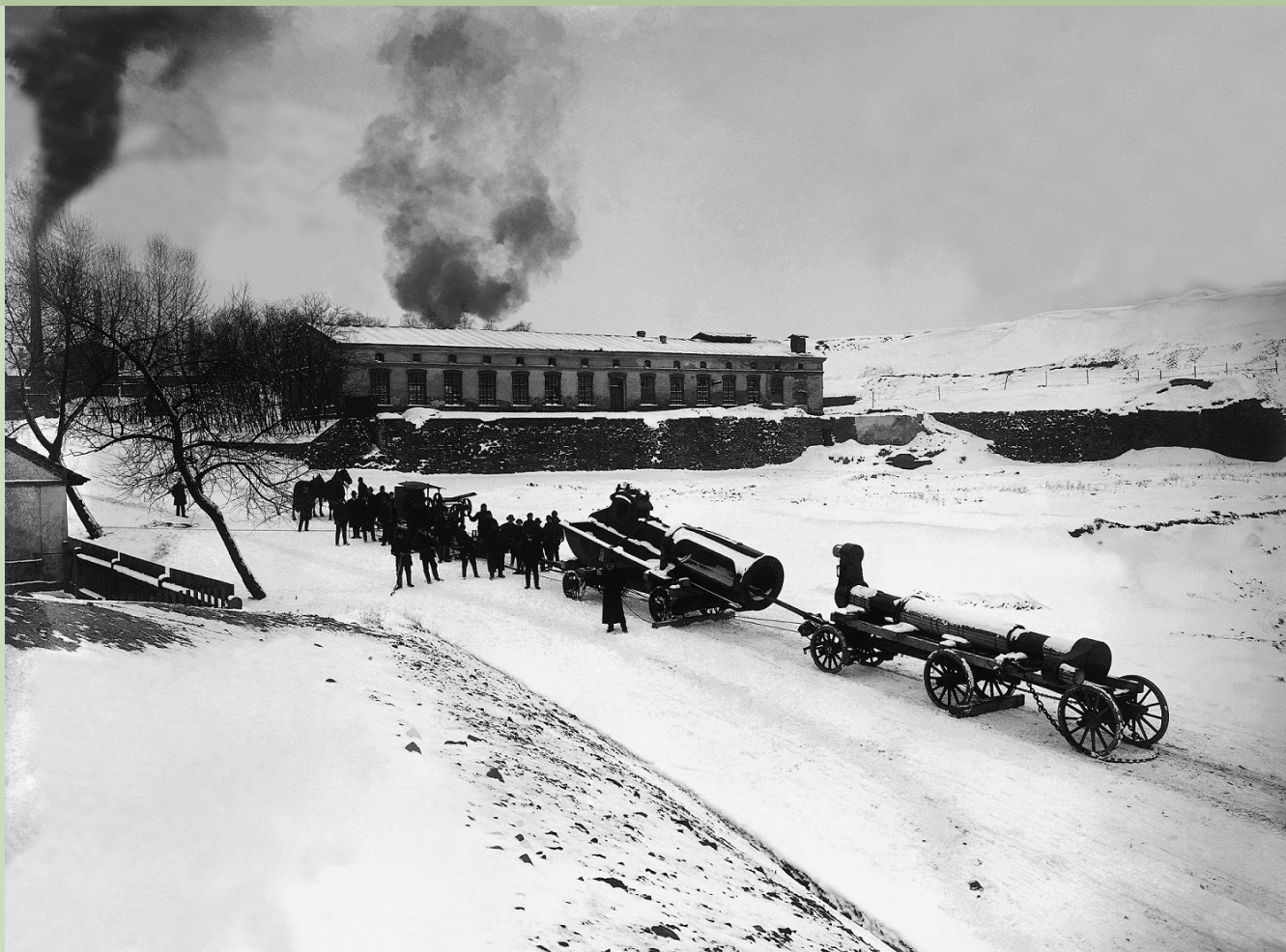
Obr. č. 5: Doprava součástí parního těžního stroje z příbramského vlakového nádraží do areálu dolu Anna v roce 1914.

strop podbitý prkny. Stěny mají hladký štuk. Ve štítech jsou menší okenní otvory, na jižní zdi určené k výstupu lan těžního stroje, směřujících k lanovnici v sousední hlavní šachetní budově. Ta se vyznačovala 32 m vysokou ocelovou příhradovou těžní věží, která tvořila dominantu Březových Hor až do demontáže v roce 1980. U vchodu strojovny je zavěšen kovový panel s profilovaným ozdobným rámem s adjustovanými montážními klíči k údržbě stroje. V úrovni terénu byla vybudována mozaiková podlaha (terazzo), na několika místech zdobená hornickou symbolikou – zkříženým železákem a mlátkem. Litinové (bajonetové) rámy těžního stroje jsou připevněny k hladkým betonovým soklům. Podstavce parních válců jsou přišroubovány přímo k podlaze strojovny. Kotvící šrouby končí hluboko v podzemním podlaží. Parní těžní stroj je kryt lesklými modročernými plechy. Sál strojovny